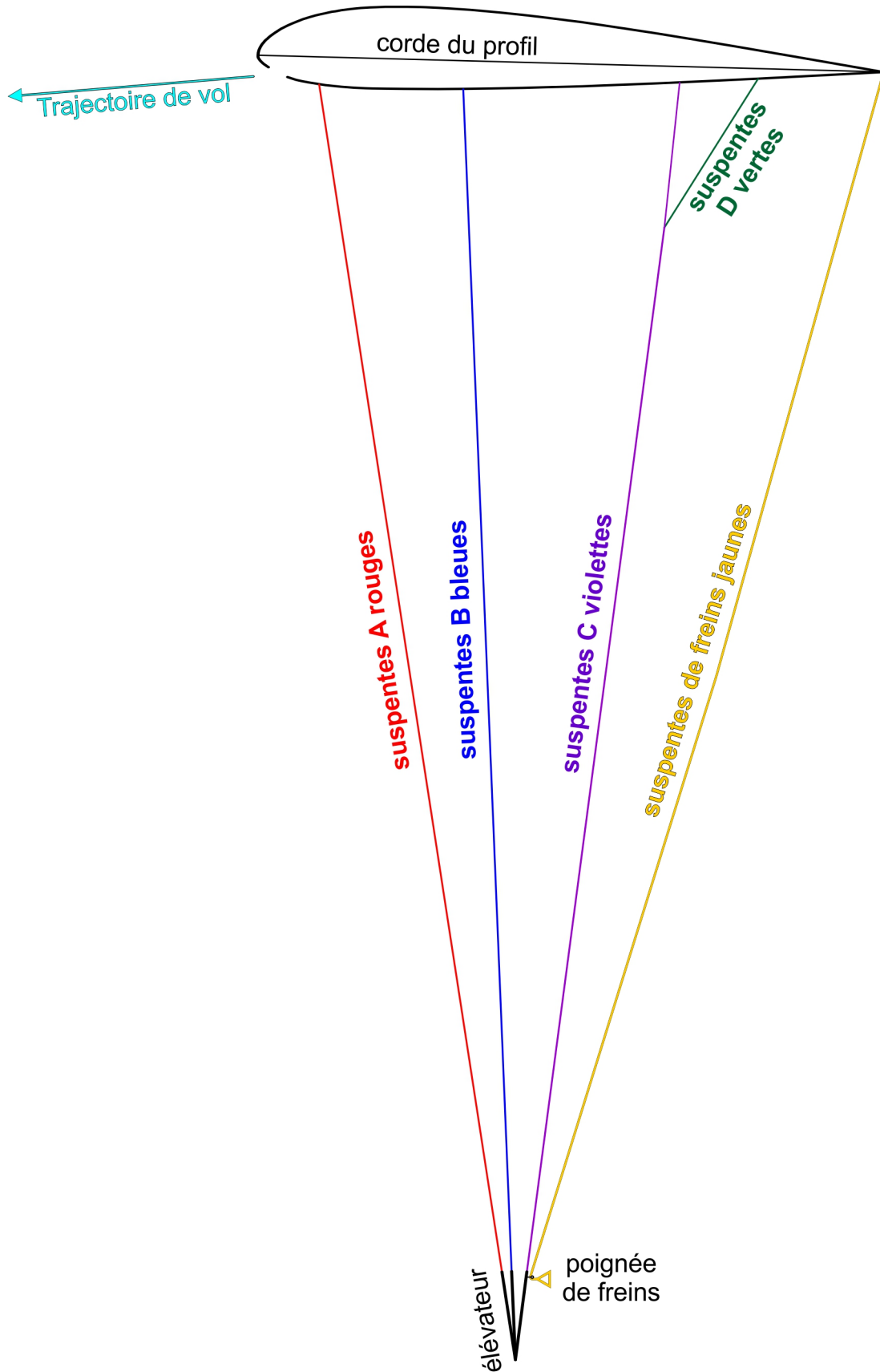
Illustration l'EXPLORA en coupe