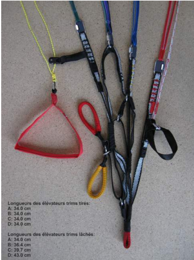
Schéma d'un élévateur

Longueurs des élévateurs trims tirés: A: 34.0 cm B: 34.0 cm C: 34.0 cm D: 34.0 cm